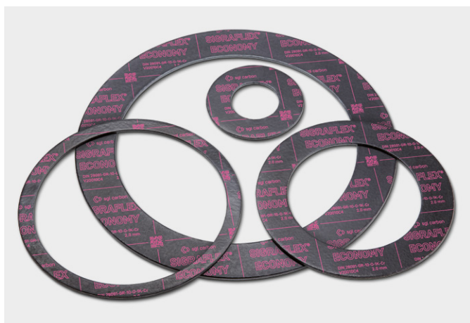
↑ Těsnění z SIGRAFLEX ECONOMY