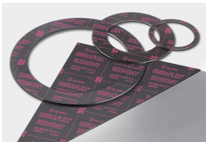
↑ SIGRAFLEX ECONOMY Těsnící desky a těsnění